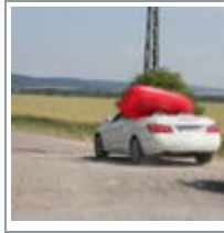
Heiß auf Wasser und Eis