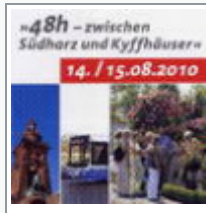
48-Stunden-Tour zwischen Südharz und Kyffhäuser