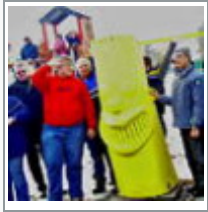
Grundschule Franzberg bekommt Computerkabinett