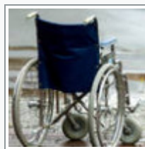
Rund 7500 Menschen im Landkreis sind schwerbehindert