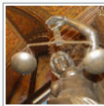
Neue Hüter der Verfassung - Vorschläge der Fraktionen stehen