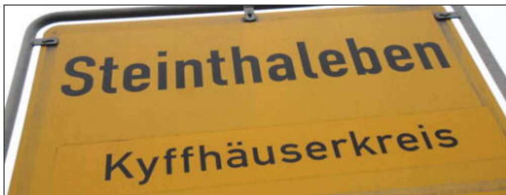
Das Verwaltungsgericht Weimar sieht das Verhalten von Nawrodt als "grenzwertig" an.