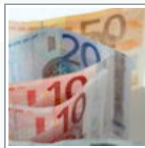
Kreistag berät am 9. Juni