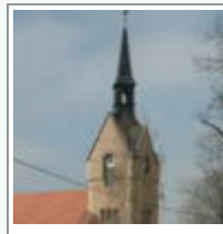
Herzbube Wolfgang Schwalm sucht in Nöbdenitz musische Talente