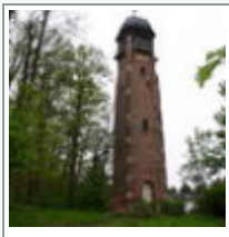
Zweiter Anlauf am Geraer Fuchsberg