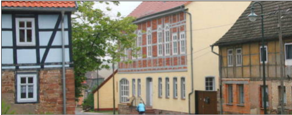
Sehr viel Geld wurden in das Dorfgemeinschaftshaus von Göllingen investiert. Die Klosterschänke ist zu, es fehlt der Wirt.

Im "Grünen See" in Steinhaleben herrscht Stille. Es ist kein Badesee. Die Gaststätte im schönen Dorfgemeinschaftshaus hat diesen Namen. Das Wirtshaus ist seit Kurzem geschlossen. Ein Schicksal, mit dem das Dorf in der Verwaltungsgemeinschaft "Kyffhäuser" nicht alleine ist.