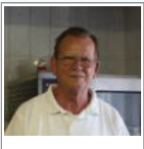
Urgestein der Greizer Gastronomie feiert 70. Geburtstag